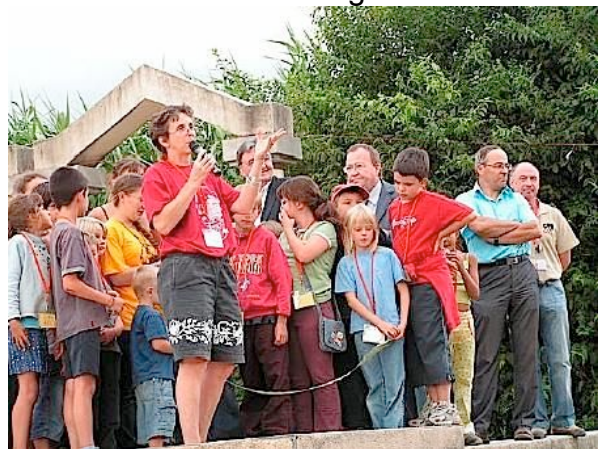
Inauguration des 12 èmes Rencontres CPN à St Bauzille.

Ça n'a pas été aventure facile, une histoire de fous d'organiser autant de bénévoles dans une entreprise d'un an de travail... Fantastique mise au travail d'un territoire qui ne fait plus grand chose ensemble. Et tous ont été sur le pont, même et surtout les éloignés des CPN !