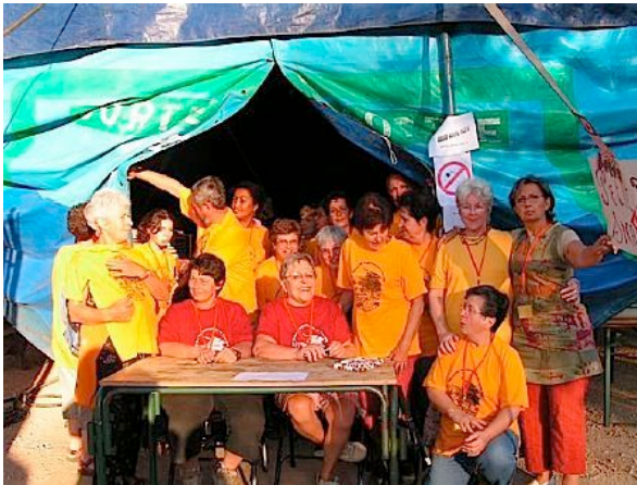
Les bénévoles de l'intendance

C'est bien l'objet des rassemblements CPN : faire croiser l'affaire de la protection de la nature au grand public, aux copains et aux autres, aux intellectuels comme aux manuels, à tous, les jours où tous les CPN du monde viennent se donner la main pour discuter et repartir avec un plein d'énergie commune.