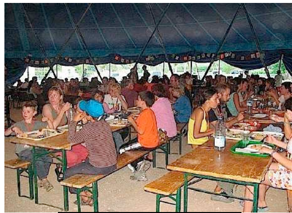
Vue d'un repas pour 400 CPN

L'opération a réussi sur tous les plans.