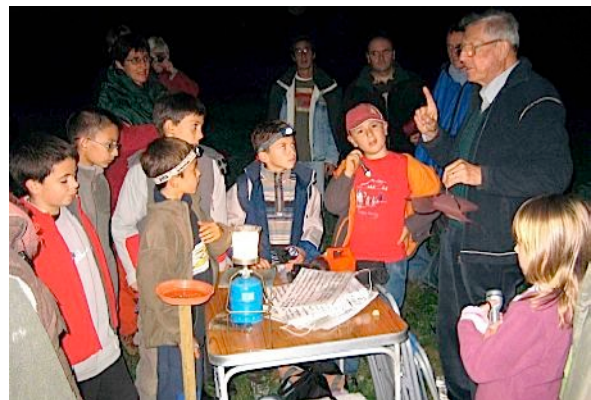
Astronomie à l'école buissonnière des CPN