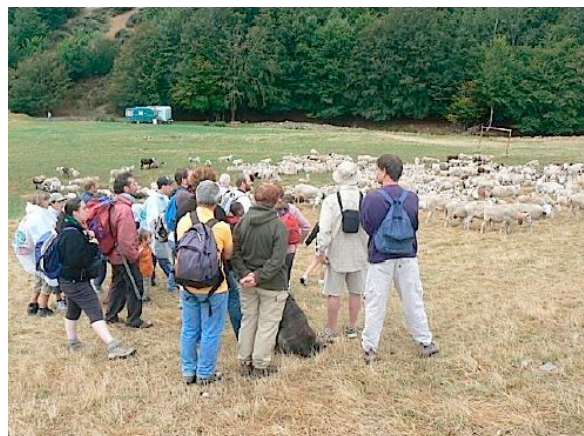
Les CPN visitent les bergers des Cévennes

L'élevage ovin transhumant des garrigues d'ici y retrouverait par la même une haute qualité environnementale, valeur qui lui est aujourd'hui bien difficile d'accrocher entre toutes les directives et aides agricoles, même et surtout en zone méditerranéenne, où l'urbanisation des garrigues arrive plus vite que la connaissance, la protection et l'enrichissement partagé du milieu.