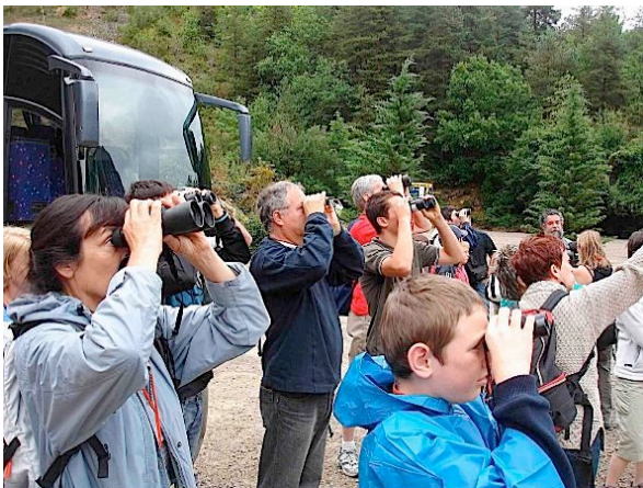
des CPN aux jumelles à la Jonte

Et là, il n'y aura pas longtemps à faire des comptes ; même les chasseurs de sanglier du secteur avec leurs 20 tonnes annuelles de déchets de chasse aimeraient trouver une solution durable et économique ; les autres éleveurs, les pisciculteurs réfléchissent... Ah, quand l'économie rejoint l'écologie.