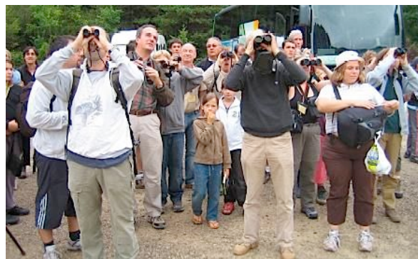
Vautours en vol dès l'arrivée des CPN et des bergers

Nous ne remercierons jamais assez tous les participants qui ont joué le jeu, petits comme grands, quelqu'en soit leur place.