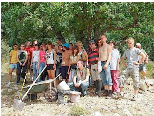
Chantier nature: fabrication d'un observatoire sur lagunage avec l'aide de CPN roumains

C'était faire exister chez nous en garrigue Montpelliéraine quatre jours de bonheur entre tous, des rencontres inoubliables dans des paysages fantastiques avec des échanges de grande richesse entre des gens qui ne se rencontrent a priori jamais.